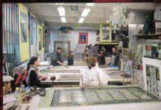
Une partie de l'intérieur de l'atelier