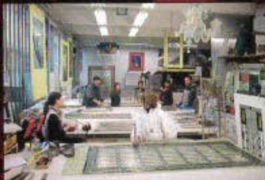
Une partie de l'intérieur de l'atelier